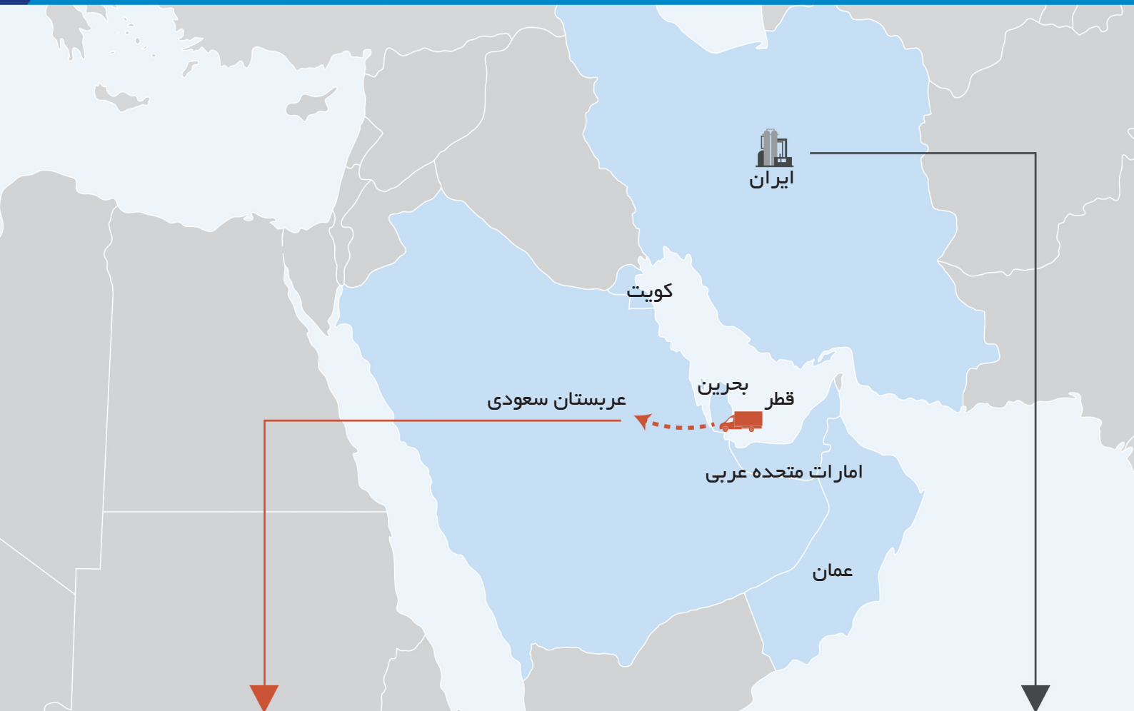
صادرات مواد و محصولات شیمیایی شورای همکاری خلیج فارس (میلیون تن)